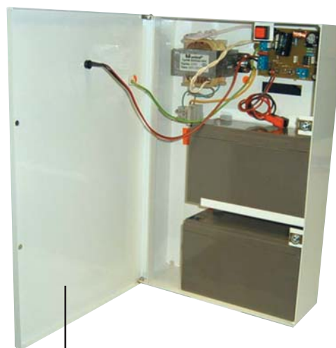
PS2410 - 24 V 1A

Assistance technique : ligne directe 01 45 16 19 21